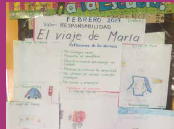
Preescolar Rosario Vera Peñaloza Zona 45 Turno Matutino