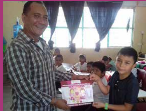
Primaria Emiliano Zapata Zona 66 Sector 14 Turno Vespertino