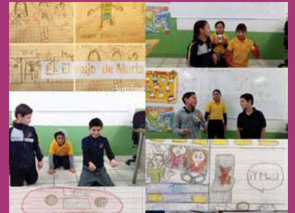
Primaria Justo Sierra Méndez Zona 63 Turno Matutino