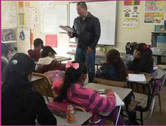
Prim. Liberación 2791 Zona 39 Turno Matutino