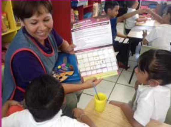
Preescolar Benito Juárez 1026 Zona 29 Turno Matutino