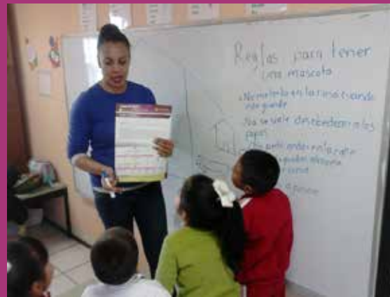
Preescolar Graciela Hierro Zona 58 Sector 12 Turno Matutino