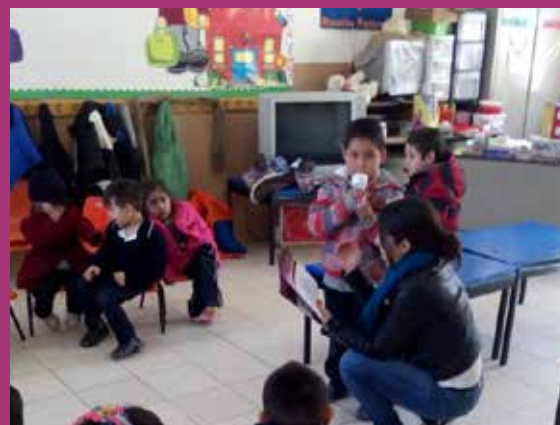
Preescolar Valle Dorado Zona 107 Turno Matutino