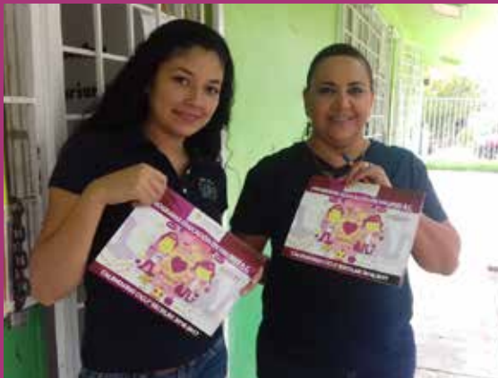
Primaria Club Sertoma Zona 48 Sector 10 Turno Matutino