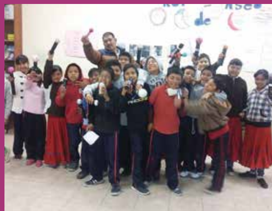
Prim. Bilingüe Tarahumara Zona 25 Turno Matutino