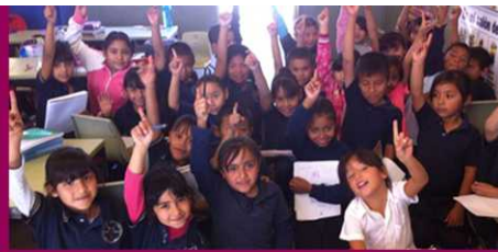
PRIM. HÉCTOR MUELA ZONA 77 SECTOR 17 TURNO MATUTINO