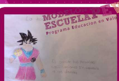
PREESCOLAR MARIA BRICIA RODRIGUEZ ZONA 57 SECTOR 12 TURNO VESPERTINO