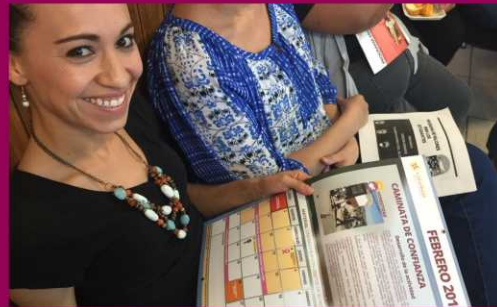
PRIM. JUSTO SIERRA ZONA 64 SECTOR 14 TURNO MATUTINO