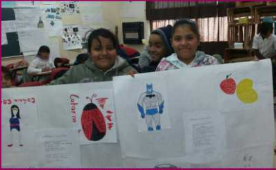
PRIM. BILINBUE TARAHUMARA ZONA 25 SECTOR 9 TURNO MATUTINO