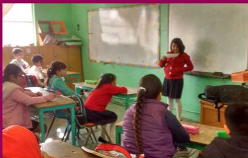
PRIM. ABRAHAM GONZÁLEZ ZONA 46 TURNO VESPERTINO