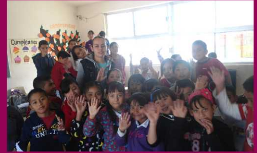
PRIM. MARTIN LUTHER KING ZONA 83 SECTOR 18 TURNO MATUTINO