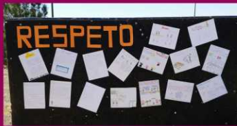
PRIM. CARLOS URQUIDI GAYTAN ZONA 74 SECTOR 16 TURNO MATUTINO