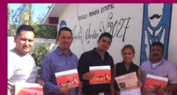
PRIM. AQUILES SERDAN ZONA 4 TURNO MATUTINO