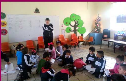
PREESCOLAR ALTAVISTA ZONA 74 SECTOR 10 TURNO MATUTINO