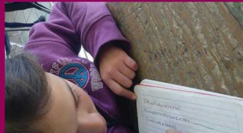
PRIM. IGNACIO DUARTE TARIN ZONA 82 SECTOR 18 TURNO VESPERTINO