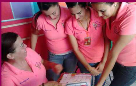
PREESCOLAR SIMÓN BOLIVAR ZONA 71 SECTOR 13 TURNO MATUTINO