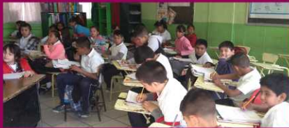
PRIM. FRANCISCO VILLA ZONA 50 SECTOR 13 TURNO MATUTINO