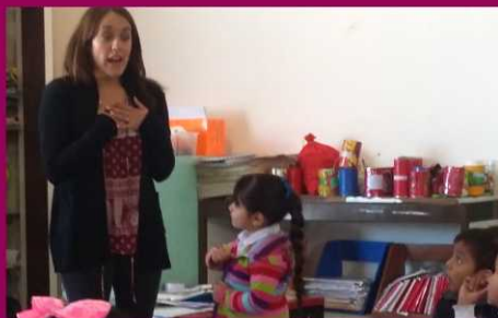
PREESCOLAR ESTEFANIA CASTAÑEDA ZONA 47 SECTOR 10 TURNO MATUTINO